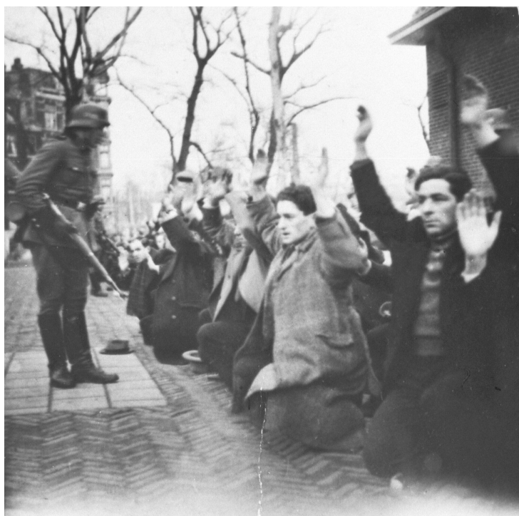
Razzia am Jonas Daniël Meijerplein in Amsterdam, 22. Februar 1941.

Jonas Daniel Meijerplein in Amsterdam aufstellen und wurden von Mitgliedern der Ordnungspolizei zu einem Spießrutenlauf in den umliegenden Gassen gezwungen. 26 Insgesamt ließ die Besatzungsmacht 425 Juden verhaften, um sie anschließend von Amsterdam über das Lager Schoorl in das Konzentrationslager Buchenwald zu verschleppen. 27 Im Juni 1941 wurden von Buchenwald 348 der mehr als 400 aus den Niederlanden deportierten Juden in das Konzentrationslager Mauthausen überstellt. 28 50 der in Mauthausen neu angekommenen Häftlinge wurden auf der Stelle ermordet, für den Rest begann der Arbeitseinsatz im Steinbruch. Aufgrund der unmenschlichen Arbeitsbedingungen und der brutalen Behandlung starben alle Amsterdamer Häftlinge in kürzester Zeit. 29